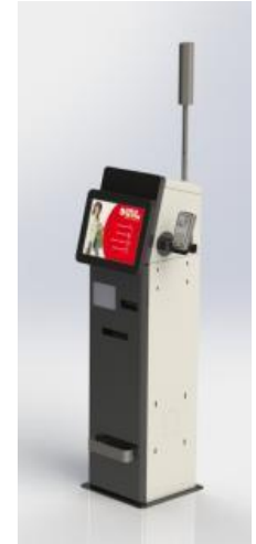
Mini Pay Station