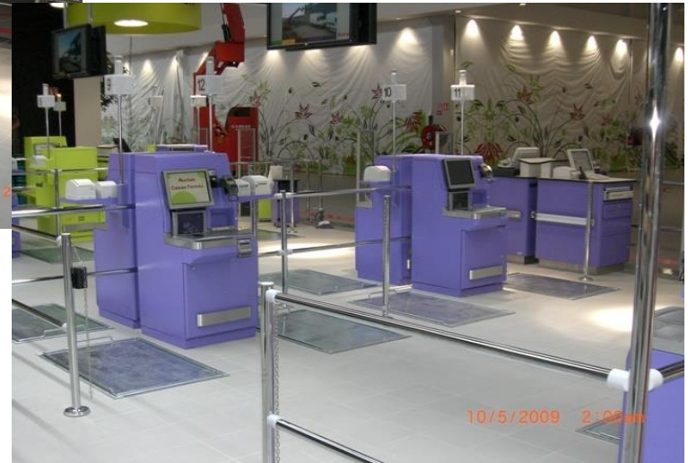
Self Checkout mit Bodenwaagen