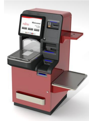
U-Scan Pay Station