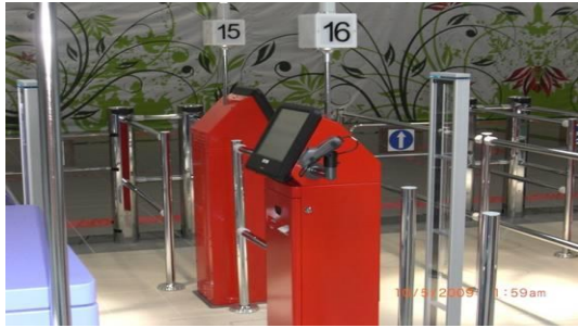
Bargeldlose Zahlstationen mit Sicherheitsschleusen