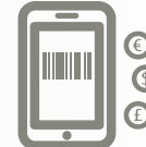
Scan & Pay